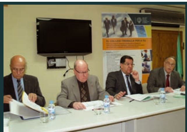
Moment de l'Assemblea General a la seu gironina del col·legi el 13 de desembre: dia de les eleccions del col·legi de Girona. D'esquerra a dreta: L'advocat del col·legi, el comptador, el president electe i el secretari.