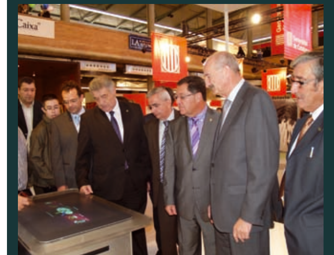
Moment del recorregut per la Fira comercial durant una visita a l'estand de la Cambra de Comerç de Girona.