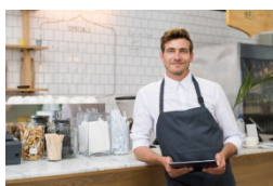
Flexibilidad y orientación al cliente

Nos posicionamos como una de las empresas con mayor conocimiento, experiencia y liderazgo; dentro del mercado del sector de la energía eléctrica.