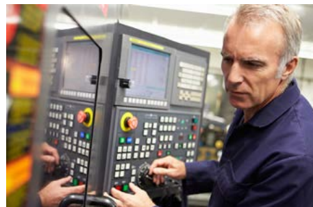
Negocios y PYMES